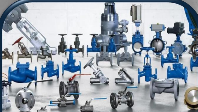
SUMINISTRO DE RESPUESTOS