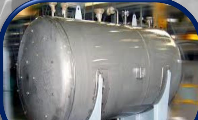
TANQUES Y RECIPIENTES A PRESIÓN