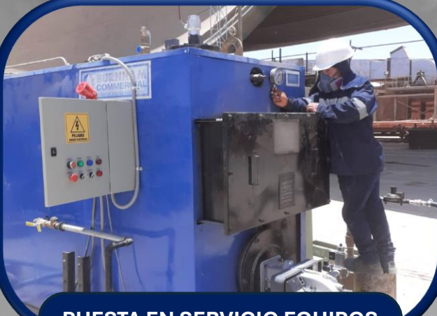
PUESTA EN SERVICIO EQUIPOS