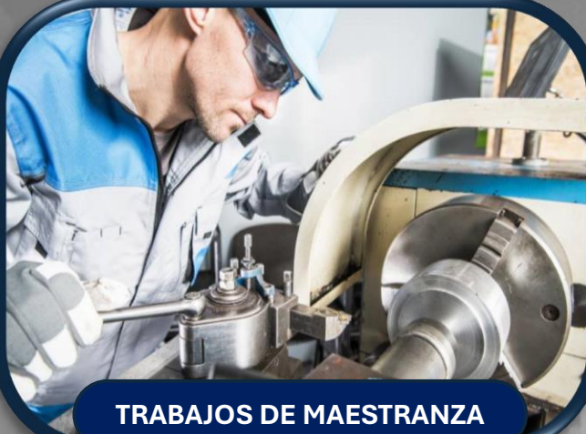
TRABAJOS DE MAESTRANZA