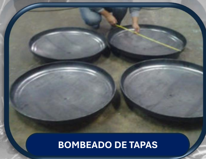
BOMBEADO DE TAPAS