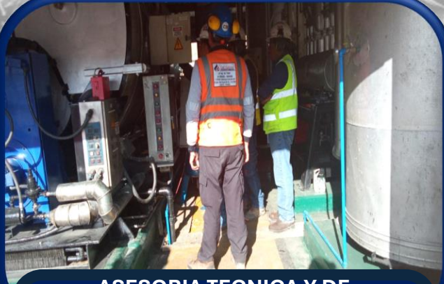
ASESORIA TECNICA Y DE INGENIERIA