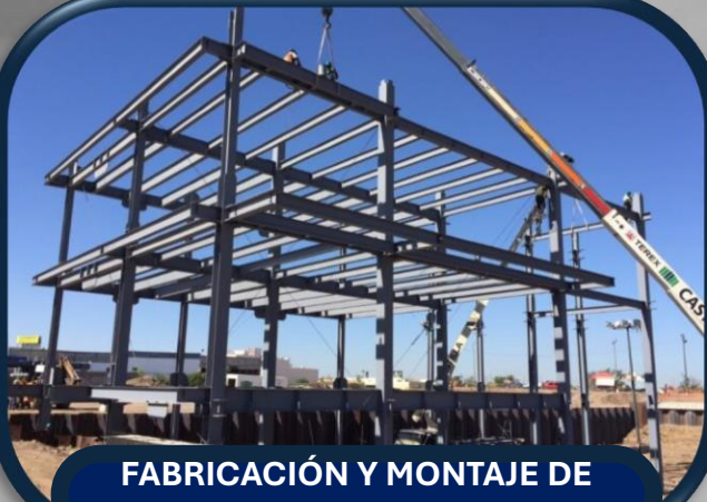
FABRICACIÓN Y MONTAJE DE ESTRUCTURAS METALICAS