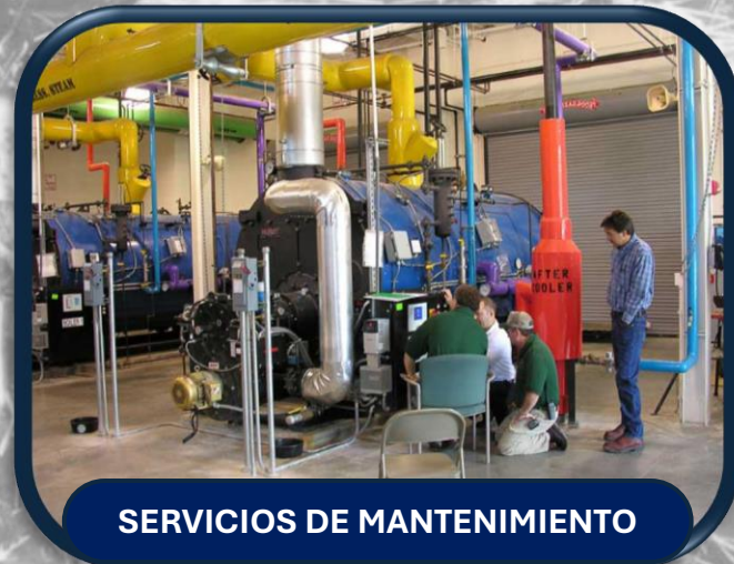
SERVICIOS DE MANTENIMIENTO