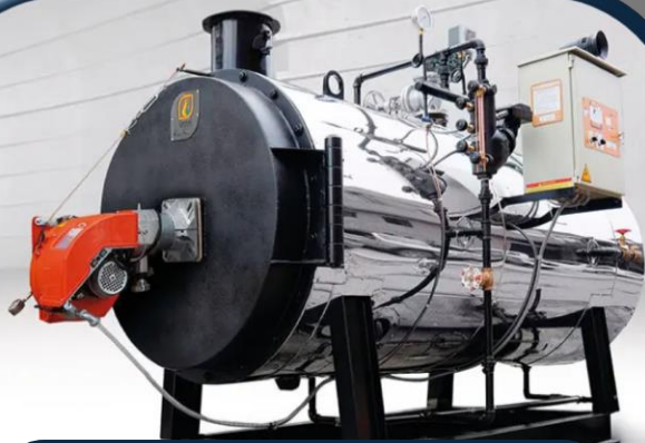
CALDERAS DE VAPOR , AGUA CALIENTE, ACEITE TERMICO